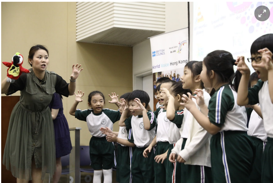
唱歌學習英文有多大成效？一眾小學生即場演唱。