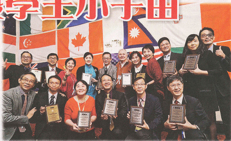
▲ 本港得獎學校代表合照

啟發潛能教育在香港發展漸趨成熟，多間學校都取得驕人成果。因此，IAIE (香港) 把 IE 引進內地的中小學，培訓內地不同地方學校的教職員，把多年來在香港實施 IE 累積的經驗與內地學校交流。展望將來，希望啟發潛能教育可在內地普及，改善內地教育，讓更多學生的潛能得以發揮。