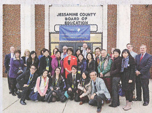
▲ ▼ 得獎學校代表到美國當地推行 IE 的學校交流，獲熱烈歡迎。