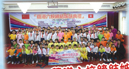
穗港六校締結姊妹典禮